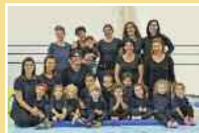
Età: 2013-2014 Tassa: Fr. 80.–

Genitore-bambino Il bambino scopre il mondo della ginnastica attraverso il gioco, il canto, il movimento e il divertimento, accompagnato da un genitore.