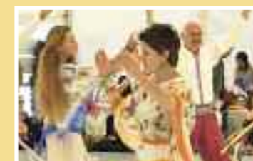
Età: dai 18 anni Tassa: Fr. 160.–

Uomini calcetto Passare qualche ora piacevole in compagnia mantenendosi in forma giocando a calcetto in palestra. Età: dai 18 anni Tassa: Fr. 100.–