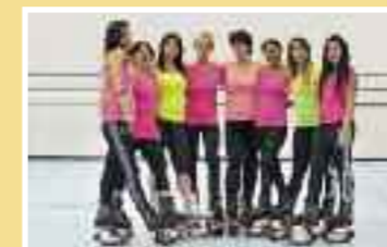
Kangoo Fit principianti Età: dai 18 anni Tassa: Fr. 150.–

Kangoo fit Il continuo movimento a rimbalzo, grazie alle apposite scarpe, rinforza articolazioni, spina dorsale e caviglie, stimolando equilibrio e propriocezione. Tende a migliorare tutte le caratteristiche aerobiche. Non sono necessarie spiccate caratteristiche ginniche o particolari livelli di preparazione.