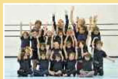
Età: 1a-5a elementare Tassa: Fr. 80.–

Infantile I bambini imparano a staccarsi dalla mamma e iniziano a familiarizzare con gli attrezzi; sono stimolati ai giochi di gruppo e a migliorare i loro movimenti naturali, correndo, saltando, giocando.