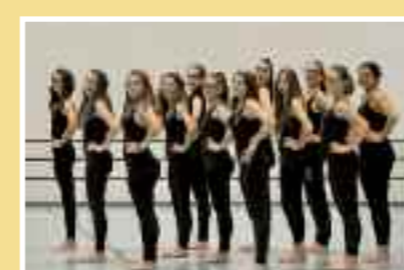
Gymnastique alunne 2 competizione Giubiasco-Sementina Età: 2004-2001 Tassa: Fr. 90.–