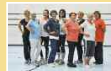
Gruppo Arianna Età: dai 18 anni Tassa: Fr. 100.–

Donne Ginnastica per tutte le età. Rilassarsi, divertirsi e mantenersi in forma con semplici esercizi a terra e agli attrezzi con accompagnamento musicale.