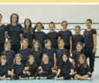
Tassa: Fr. 90.–