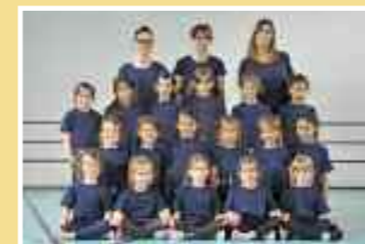
Gymnastique alunne 1 NON competizione Età: dal 2013 Tassa: Fr. 80.–