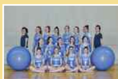
Attrezzistica test 5-6-7 Per chi ha superato i test 3-4 Tassa: Fr. 110.–