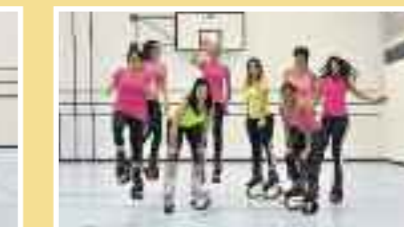
Kangoo Fit avanzati Età: dai 18 anni Tassa: Fr. 150.–