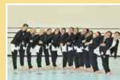
Gymnastique attive Giubiasco-Sementina Età: dal 2001 Tassa: Fr. 110.–

Gymnastique Basata sulla tecnica della ginnastica ritmica sportiva, si sofferma sull'aspetto della danza, della coreografica e dell'estetica. Sviluppa il senso del ritmo, creatività e fantasia. Gli esercizi si svolgono con la musica e dei piccoli attrezzi: fune, cerchio, palla, clavette e nastro. È prevista la partecipazione a gare cantonali e federali.