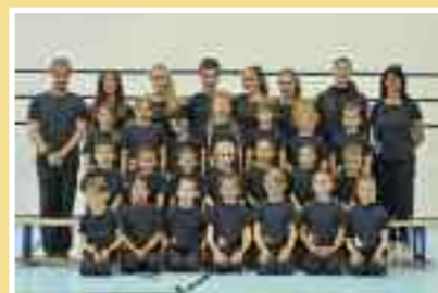
Attrezzistica test 1-2 Età: dal 2010 Tassa: Fr. 80.–

Artistica femminile Prevede volteggio, trave, parallele asimmetriche e corpo libero con musica. Necessita forza, mobilità articolare e coordinazione, nonché impegno, allenamenti assidui e disciplina. È prevista la partecipazione a gare cantonali e federali. Test attitudinale d'entrata.