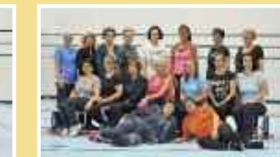
Gruppo Jelena Età: dai 18 anni Tassa: Fr. 100.–