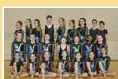
Attrezzistica test 3-4 Per chi ha superato i test 1-2 Tassa: Fr. 90.–

Attrezzistica Sport di grande effetto e spettacolarità che va introdotto in giovane età e accuratamente sviluppato con costanza e volontà. Si divide in 4 discipline: anelli, sbarra, suolo, salti con il trampolino. È prevista la partecipazione a gare cantonali e federali.